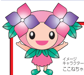
イメージキャラクター ここねちゃん